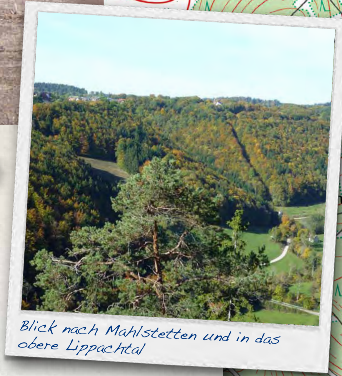
Blick nach Mahlstetten und in das obere Lippachtal

Die Wallfahrtskirche Aggenhausen wurde bereits im Jahr 793 als Wallfahrtskirche erwähnt. Noch heute finden dort an den Maisonntagen feierliche Andachten statt.