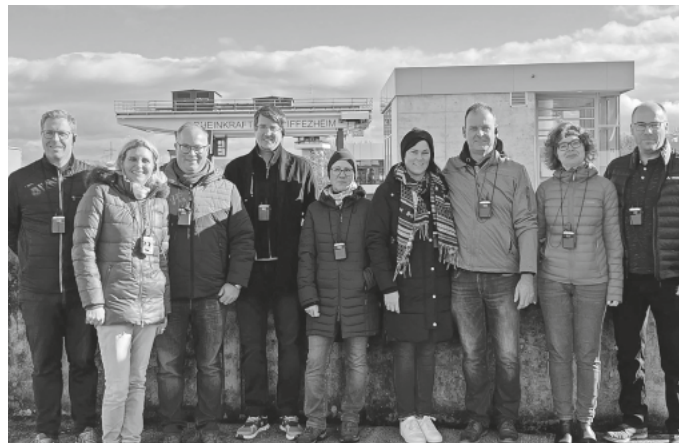
Die Teilnehmer der Informationsfahrt vor dem Wasserkraftwerk Iffezheim.

Vor der Rückreise am Samstag erhielt die Gruppe noch eine Führung durch das Casino Baden-Baden. Außerhalb des eigentlichen Spielbankbetriebs konnten neben den verschiedenen Angeboten insbesondere die Gestaltung der historischen Säle bewundert werden.